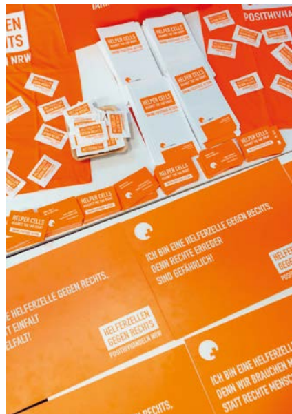
Materialien der Kampagne „HELPERZELLEN GEGEN RECHTS“ von POSITHIV HANDELN NRW

Die Normalisierung rechtspopulistischer und rechtsextremer Positionen schreitet weiter voran. Laut der aktuellen Leipziger Autoritarismus-Studie stimmen immer mehr Menschen rassistischen und antisemitischen Aussagen zu. Zudem zeigt sich bei fast 40 % der Befragten manifeste