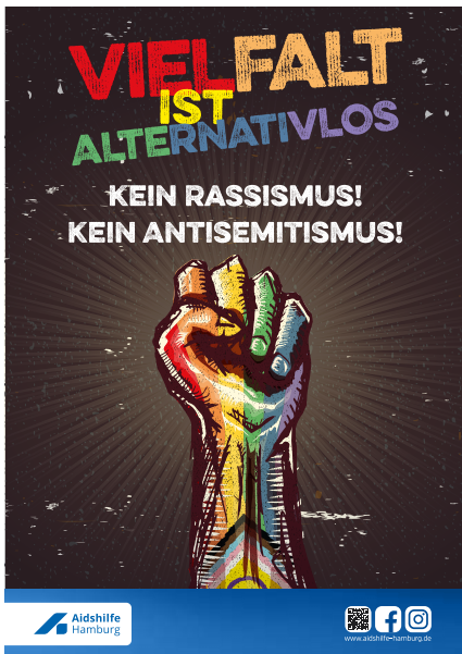
Kampagne der Aidshilfe Hamburg zu den Europawahlen und dem HamburgPride 2024

Die Normalisierung rechtspopulistischer und rechtsextremer Positionen schreitet weiter voran. Laut der aktuellen Leipziger Autoritarismus-Studie stimmen immer mehr Menschen rassistischen und antisemitischen Aussagen zu. Zudem zeigt sich bei fast 40 % der Befragten manifeste