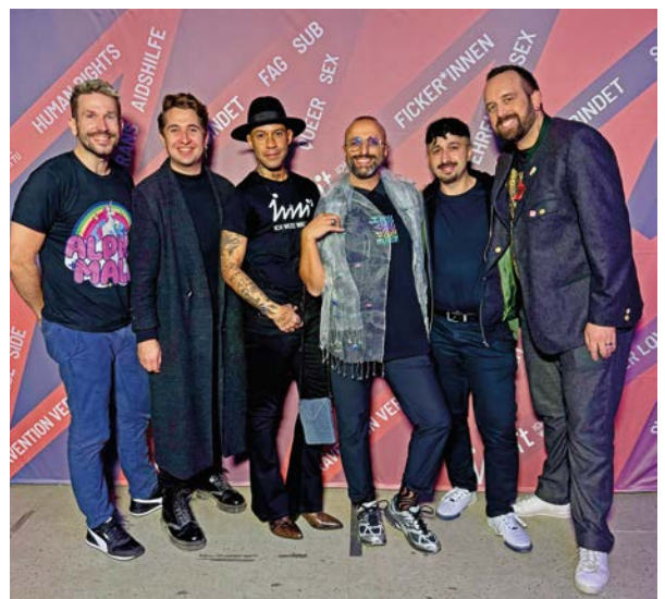
Das IWWIT-Team der Deutschen Aidshilfe beim Community-Abend im Berliner SchwuZ