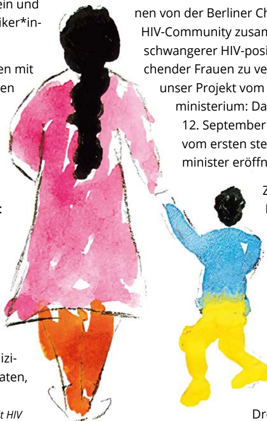
Aquarell einer tadschikischen Frau zu ihrem Leben mit HIV

Ziel ist es, gemeinsam mit HIV-positiven Frauen aus Tadschikistan Multiplikatorinnen aus ländlichen Gebieten auszubilden. Diese sollen Frauen, die nur eingeschränkten Zugang zu HIV-Kliniken haben, professionell zu den Themen HIV, Schwangerschaft, Stillen sowie Schwangerschaft und Drogen beraten können.