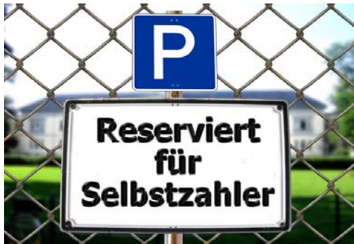
Teuere Diagnostik. Knapp 40 Euro kostet das Test-Kit von Ora-Quick im Netz.

Das US-amerikanische Expertengremium spricht sich dafür aus, den Nachteil falsch negativer Ergebnisse in Kauf zu nehmen, weil man bei breiter Anwendung mehr HIV-Diagnosen aufdecken würde. „Das nützt aber dem Einzelnen, dessen Diagnose übersehen wurde, überhaupt nichts“, so Schafberger.