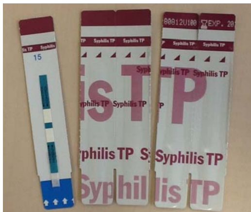
Forschergemeinde zerrissen bei der Bewertung des Syphilis-Schnelltests.

Sind gängige Syphilis-Schnelltests in der Lage, alle Infektionen nachweisen? Oder werden Menschen mit einem falschen Gefühl der Sicherheit nach Hause geschickt? Lebhaft diskutierten Experten Mitte Juni auf dem der Deutschen STI-Gesellschaft (DSTIG) eine Vergleichsstudie. An Hand von 1000 Serumproben wurde überprüft, ob der auch von vielen Aids-hilfen verwendete Schnelltest „Alere-Determine“ genauso zuverlässig Syphilis nachweist, wie eine Laboruntersuchung.