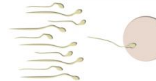
Freie Fahrt für Spermien auch bei HIV

Diskordante Paare mit Kinderwunsch können in vielen Fällen auf die Spermawäsche verzichten. Zu diesem Schluss ist jetzt ein britisches Expertengremium vom „National Institute for Health and Clinical Excellence“ (NICE) gekommen. Wenn der positive Partner durch eine antiretrovirale Therapie mit der Viruslast unter der Nachweisgrenze kommt, sei die Wahrscheinlichkeit einer HIV-Übertragung nicht höher als bei der Spermawäsche mit anschließender künstlicher Befruchtung. Die Experten definieren damit ein weiteres Setting für kondomlosen Sex.