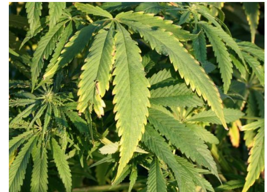
Es ist nicht immer Cannabis, was ein Suchtest findet.

Viele Substituierte werden von ihren Ärzt_innen regelmäßig auf den Beigebrauch von Drogen hin untersucht. Zum Einsatz kommen dafür Suchtests, die im Urin Rückstände von illegalen Substanzen nachweisen können. Diese Suchtests können jedoch auch falsch positiv anschlagen.